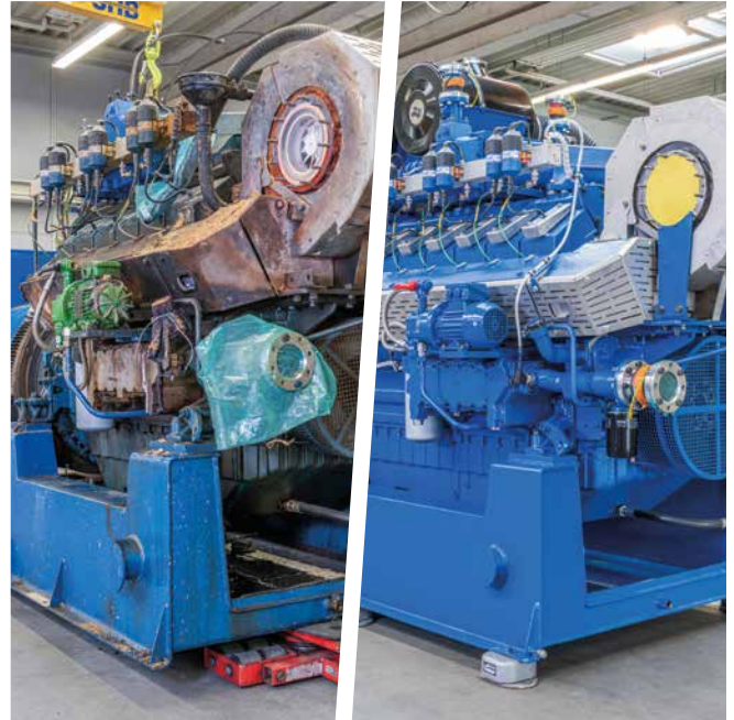
Nach 3-4 Tagen ist das MWM X-Change Aggregat (technisch auf dem neuesten Stand und frisch lackiert) einsatzbereit