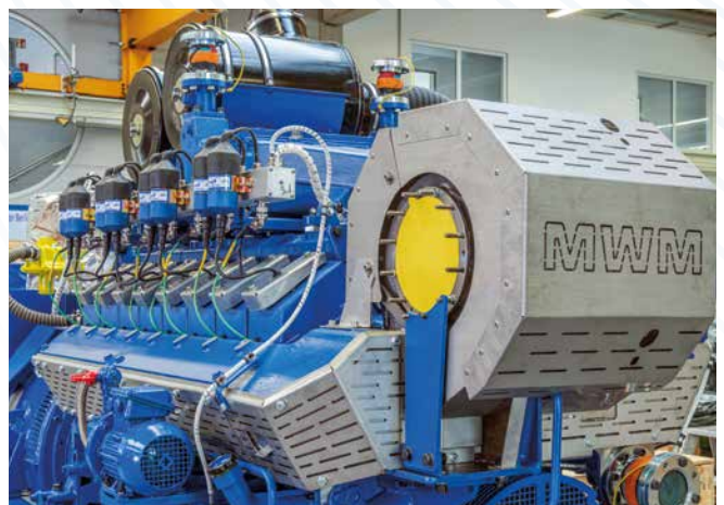
Aufbereitetes X-Change Aggregat