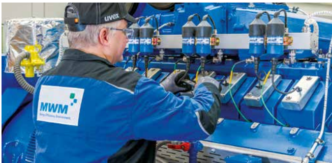
Qualitätskontrolle vor Auslieferung

Für die Generalüberholung werden ausschließlich original MWM X-Change Shortblocks und Zylinderköpfe, MWM Neu- und Ersatzteile sowie beim Hersteller überholte Komponenten verwendet. Auch die gesamte Verkabelung am Motor wird erneuert.