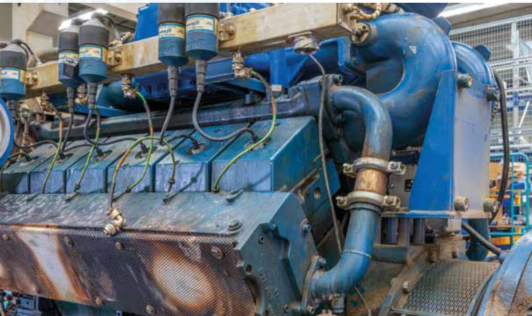
Vor der Instandsetzung

Der MWM Service bietet generalüberholte X-Change Aggregate für den TCG 2016 und TCG 2020 nach aktuellen Herstellervorgaben und zu attraktiven Festpreisen an.