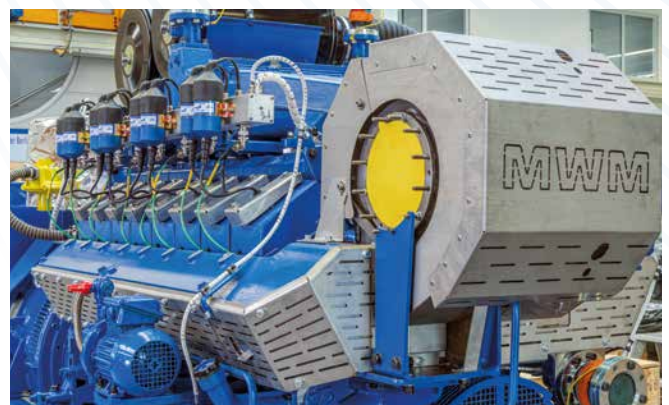
Groupe électrogène X-Change préparé