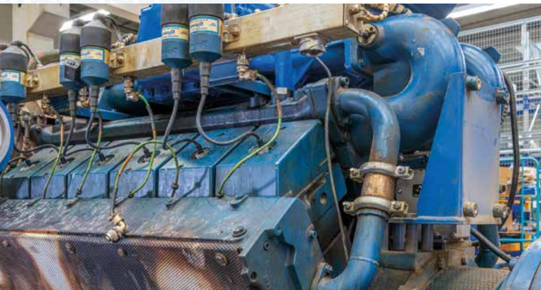
Avant la remise à niveau

Le service MWM propose des groupes électrogènes X-Change remis à neuf pour les modèles TCG 2016 et TCG 2020 conformément aux spécifications actuelles du constructeur et à des prix fixes intéressants.