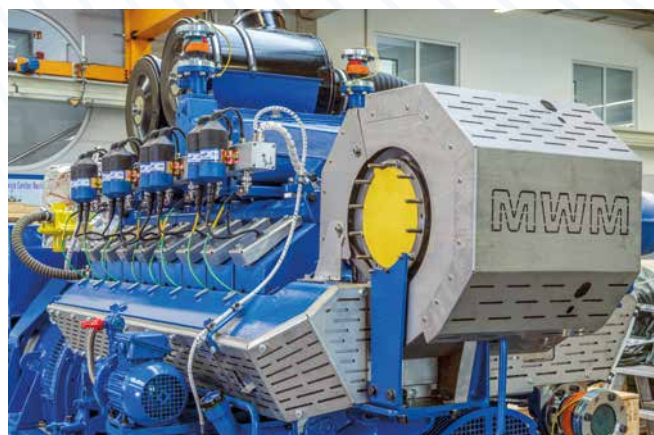
Gereviseerd X-Change aggregaat