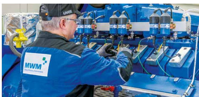
Kwaliteitscontrole vóór levering

Voor de algehele revisie worden uitsluitend originele MWM X-Change shortblocks en cilinderkoppen, MWM nieuwe en vervangingsonderdelen en bij de fabrikant gereviseerde componenten gebruikt. Ook de hele bekabeling aan de motor wordt vernieuwd.